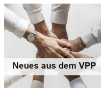
Neues aus dem VPP