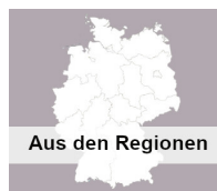
Aus den Regionen