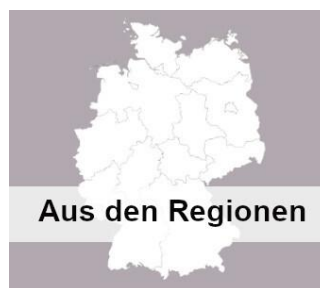
Aus den Regionen