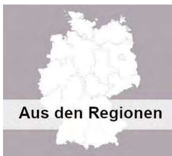
Aus den Regionen