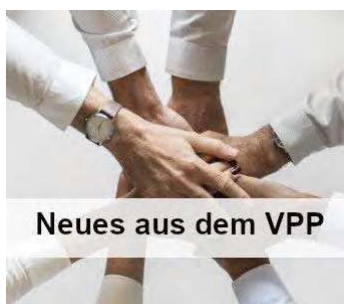
Neues aus dem VPP